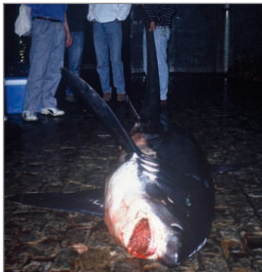
Tiburón zorro ( Alopias vulpinus ). Hembra de 4'64 metros.

Biología: Es una especie oceánica. Es ovovivíparo, con canibalismo en el útero materno. Suele tener de 2 a 6 crías, tras una gestación de unos 9 meses. Se alimenta de peces, cefalópodos, crustáceos pelágicos, etc. Parece ser que la función de su gran aleta caudal es la de azotar el