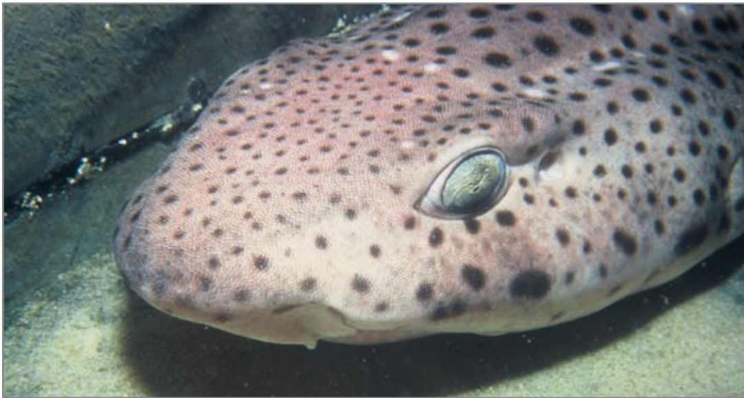
Alitán ( Scyliorhinus stellaris ). Especie parecida a la pintarroja, pero de mayor tamaño.

Estatus: Lista Roja UICN: casi amenazado.