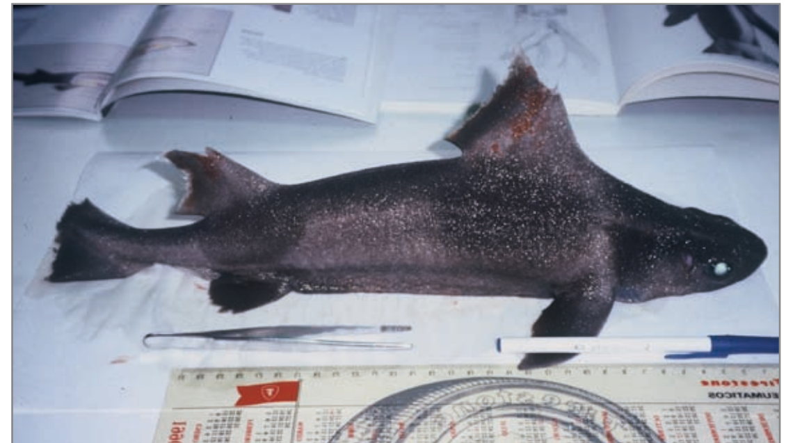
Tiburón cerdo ( Oxynotus centrina ). Su nombre común se debe a que su hocico se asemeja al de un cerdo.