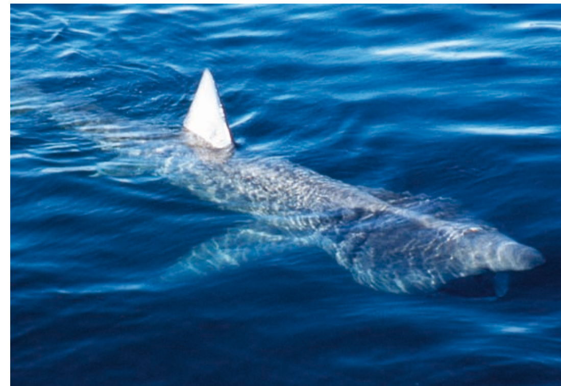
Tiburón peregrino ( Cetorhinus maximus ).