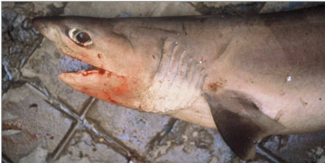
Boquidulce ( Hepranchias perlo ). Se aprecian las 7 hendiduras branquiales.

bos lados de la cabeza. Ésta es estrecha y puntiaguda, ojos muy grandes y una sola aleta dorsal. Su color es gris en el dorso y blanquecino en el vientre.