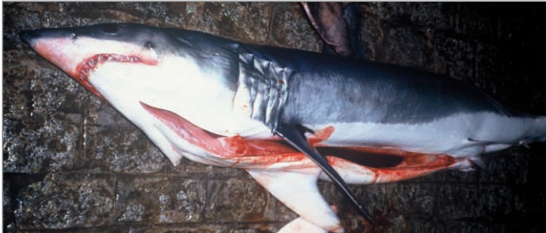
Marrajo ( Isurus oxyrinchus ) en una lonja para su comercialización.

Estatus: Lista Roja UICN: en peligro crítico de extinción.