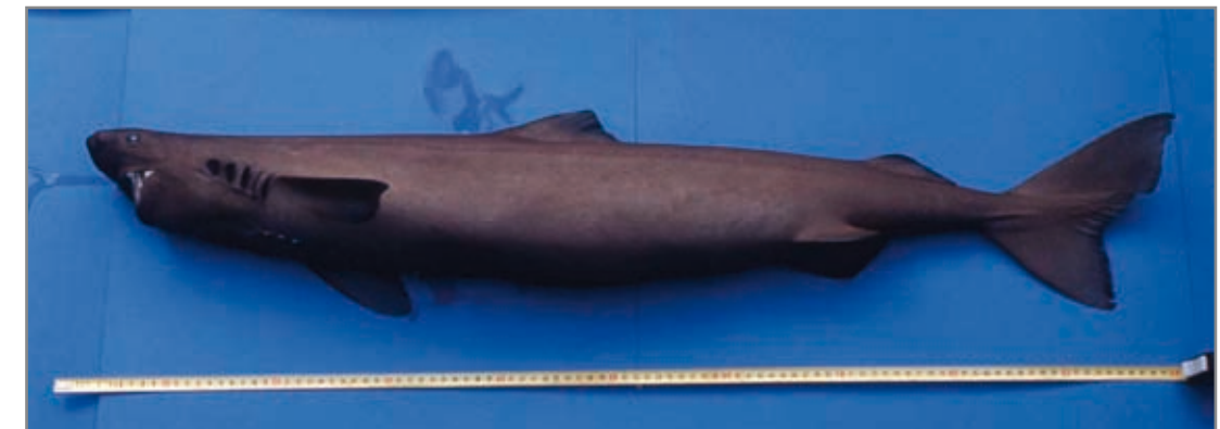
Tiburón dormilón ( Somniosus rostratus ). Se aprecia su cuerpo cilíndrico con hocico corto y redondeado.

Estatus: Lista Roja UICN: preocupación menor.