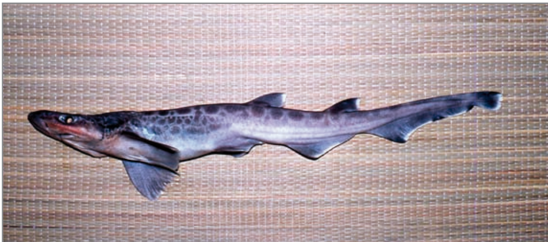
Olayo ( Galeus melastomus ). Destaca su gran aleta anal y la caudal, doblada hacia abajo.