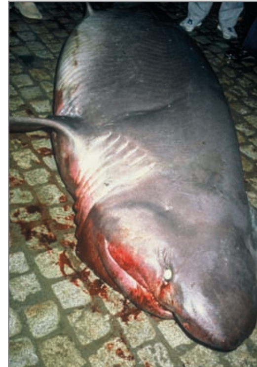
Cañabota gris ( Hexanchus griseus ) de 4'10 metros.

QUELVACHO ( Centrophorus granulosus ) Squaliformes (Bloch & Schneider, 1801)