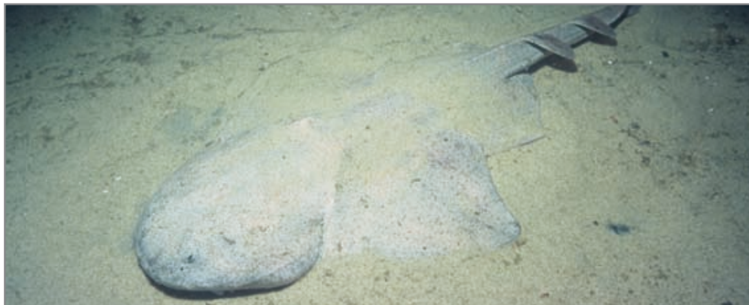
Angelote ( Squatina squatina ). Es un tiburón aunque anatómicamente se parezca a una raya. ©José Antonio Rodríguez Rodríguez