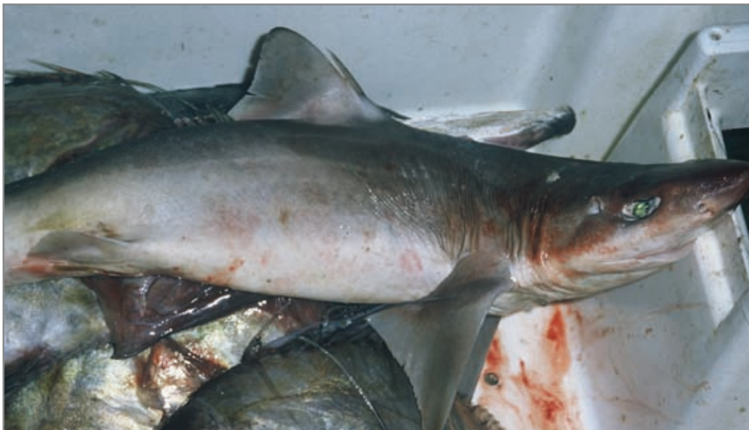
Galludo ( Squalus blainvillei ). Se aprecia la gran espina delante de la primera aleta dorsal.