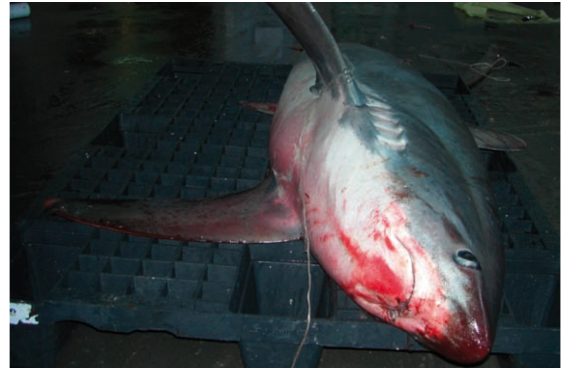
Tiburón zorro ( Alopias vulpinus )

3) Plan de Acción Internacional de la FAO para Tiburones, se trata de elaborar un Plan