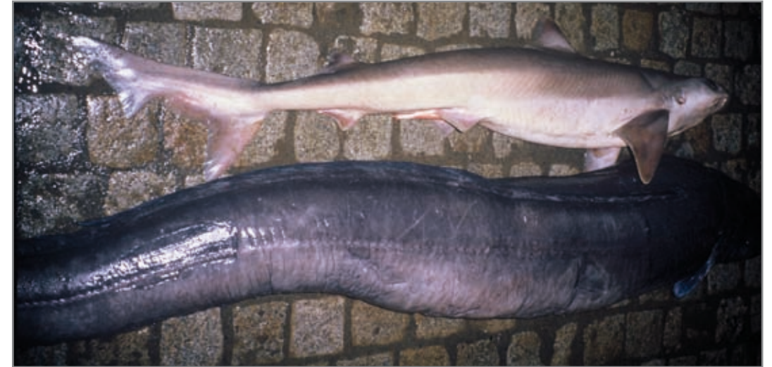
Cazón ( Galeorhinus galeus ) en una lonja para su comercialización.