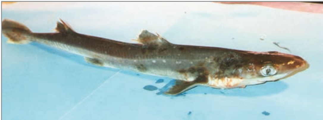
Mielga ( Squalus acanthias ). Se aprecian las dos espinas situadas delante de cada aleta dorsal. Al nacer, dichas espinas están protegidas por unas protuberancias para no dañar a la madre.