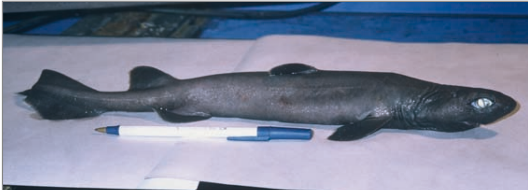
Lija ( Dalatias licha ). Joven hembra de 47 cm. de longitud total.