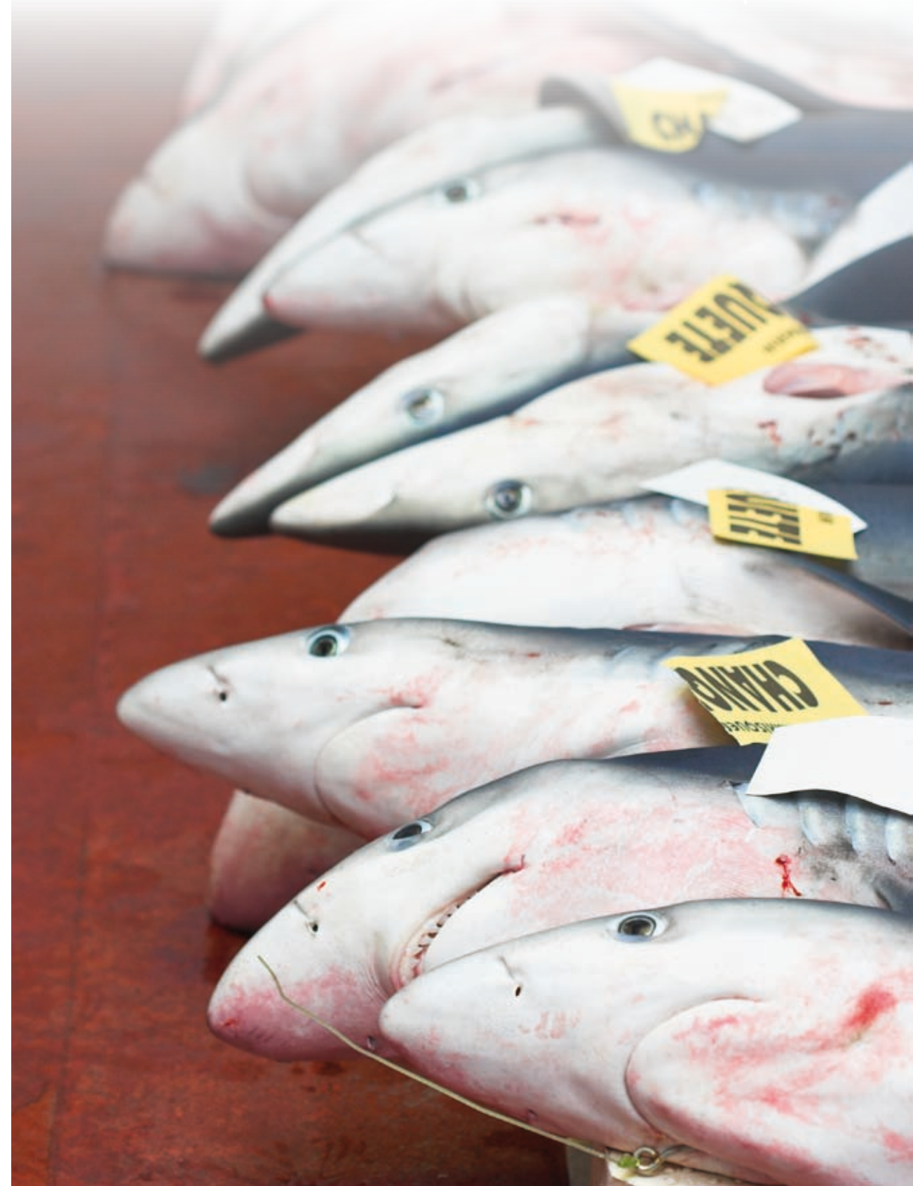
Tintorerías en la lonja de Motril

Solamente en la lonja de Motril de enero a julio de 2009 se han capturado 176 ejemplares de tiburones de distintas especies.