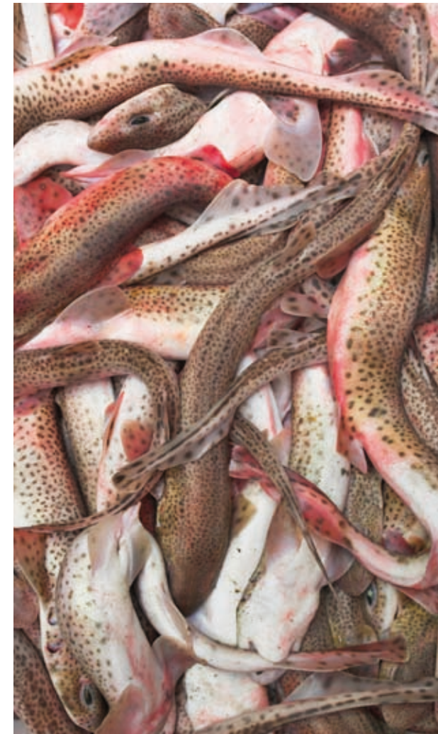
Pintarroja ( Scyliorhinus canicula ).

Estatus: Lista Roja UICN: preocupación menor.