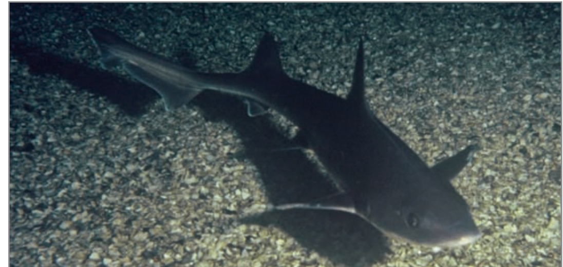
Musola ( Mustelus mustelus ). Se le aprecian las anchas aletas pectorales.