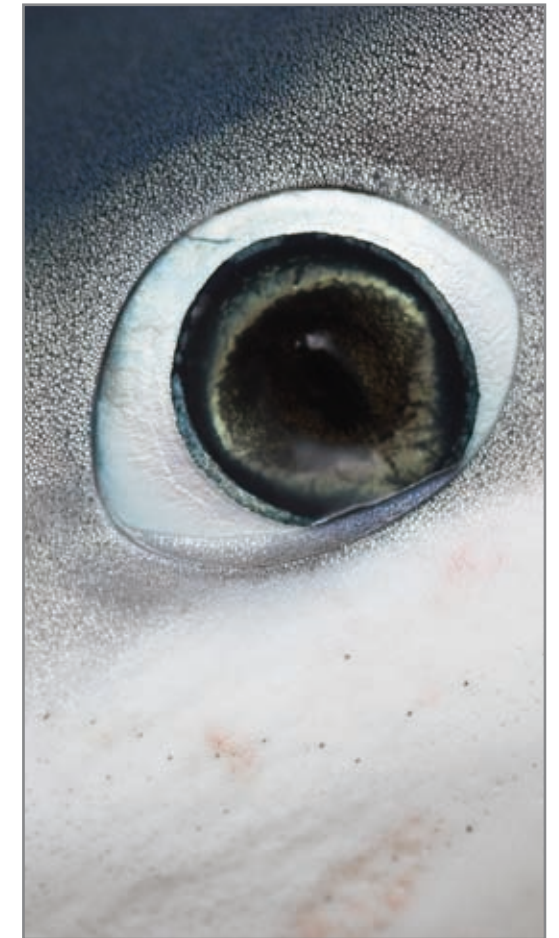
Ojo de Cazón ( Galeorhinus galeus )

Se puede dar el canibalismo intrauterino en sus dos modalidades: oofagia y embriofagia. La oofagia es la depredación intrauterina que practica el embrión más fuerte sobre los óvulos sin fecundar y fecundados. Y la embriofagia es la depredación intrauterina que practica el embrión más fuerte sobre los demás, en un mismo útero. De ahí que en estos dos casos suelen nacer solo los dos neonatos más fuertes, uno por cada útero. El número de crías de la camada depende de cada especie así como el tamaño del neonato.