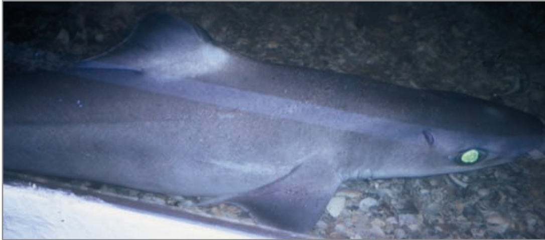
Quelvacho ( Centrophorus granulosus ). Destacan los ojos brillantes, propio de especies que viven a gran profundidad.