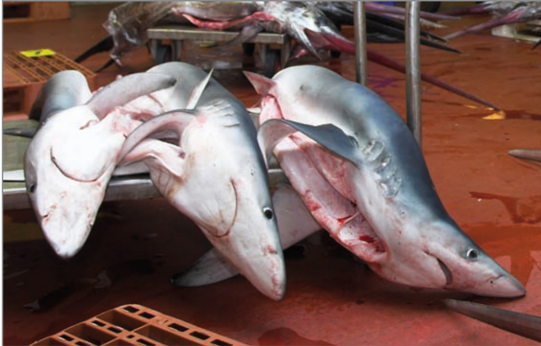
Tintoreras ( Prionace glauca ). Destacan sus grandes aletas pectorales.