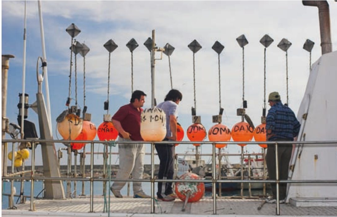
Barco palangero

España es uno de los estados que mayor número de tiburones captura al año a nivel mundial. Del tiburón se aprovecha casi todo el animal. La carne se utiliza para el consumo humano, con un precio que oscila de 6 a 8 euros por kg. Las aletas para elaborar la famosa sopa de aleta de tiburón, con un precio de 500 euros por kg. La piel se emplea para manufacturar cuero, bolsos, zapatos, etc. El cartilago vendido en cápsulas para las enfermedades de hueso. El aceite de su hígado y el escualeno como ingredientes en productos de cosmética y farmacéuticos. Los dientes y mandíbulas para la decoración.