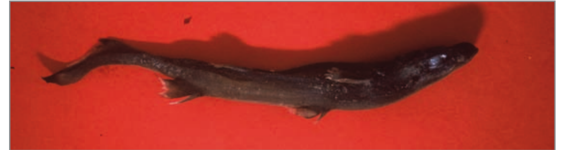
Negrito ( Etmopterus spinax ). Esta especie se caracteriza por su pequeño tamaño.

Estatus: Lista Roja UICN: preocupación menor